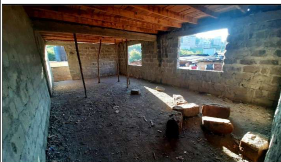
L'intérieur d'une salle de classe