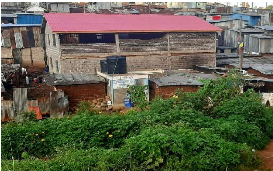
Élévation du mur en bouteilles recyclées - 1er étage