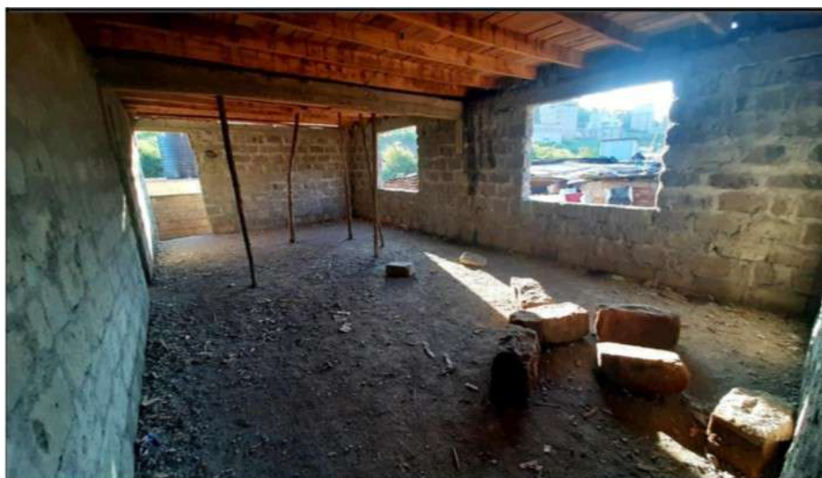
L'intérieur d'une salle de classe