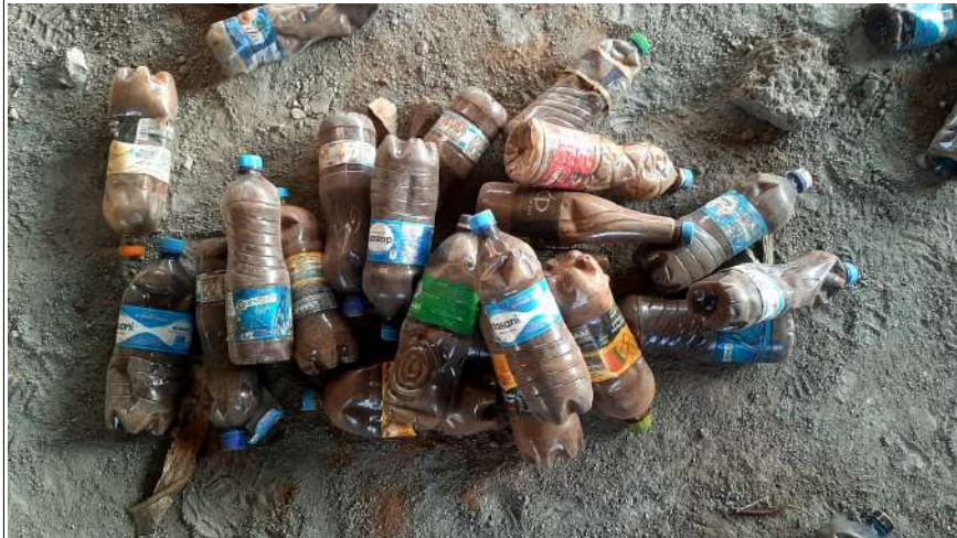
Bouteilles recyclées remplies de sable