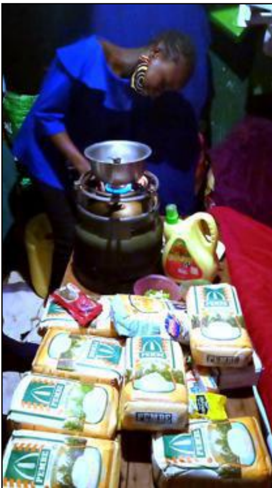
un plat de Kibera ragoût végétarien de tomates, oignons, haricots, huile et sel

Grâce au staff de Sanofi Kenya, 40 enfants de Slum Soka ont pu bénéficier d'un voucher de 3000 ksh = 27 euros. De quoi préparer plusieurs repas, pendant 2 semaines pour toute la famille !